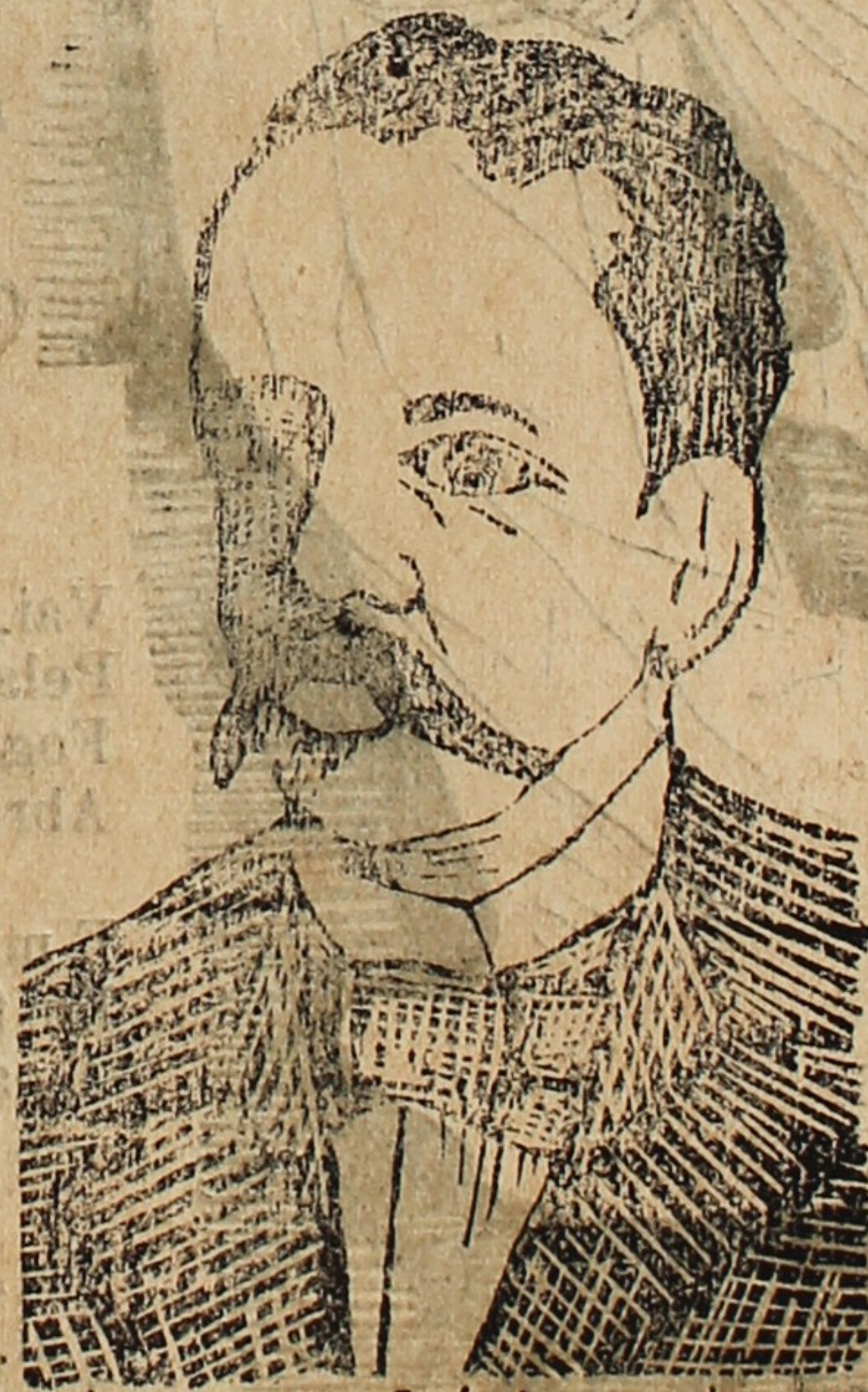
Dr. Lauro Sodré, tenente coronel do exercito brasileiro

Para Presidente da Republica seria immacula, criteriosa e progressiva.